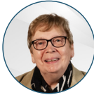
Rose-Marie FALQUE Maire d'Azerailles