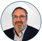
Jérôme BURDUCHÉ Maire de Marainviller