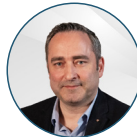
Damien MATHIVET Maire d'Hériménil