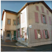
(face à l'OPH)